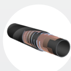
2" Wasser- schlauch