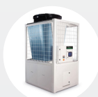
Kaltwassersatz / Wärmepumpe

Wir bieten Ihnen das komplette Zubehör um Ihr System zu vervollständigen.